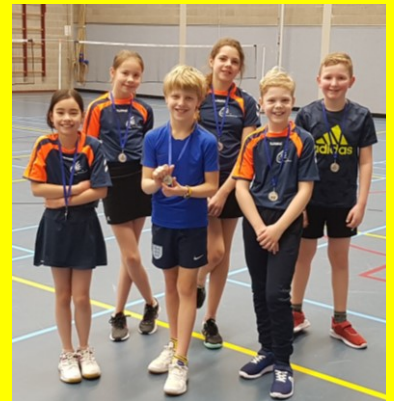
De spelers van team 4

De BBF jeugdcompetitie heeft dit jaar twee zeer succesvolle seizoenshelften gekend. Hoewel het einde van de najaarscompetitie wat rommelig verliep i.v.m. de corona-maatregelen, hebben bijna alle teams hun wedstrijden nog kunnen spelen. Team 4 speelde beide seizoenshelften tegen dezelfde tegenstanders in klasse 8, en werden heel netjes 2 e en 3 e . Team 3 werd in de najaarscompetitie kampioen, promoveerde naar de 6 e klasse, en raad eens... ze werden opnieuw kampioen!!! Nog gekker deed team 2 het. Omdat ze in het najaar ongeslagen kampioen waren geworden werd er besloten om het team twee klassen hoger in te delen (van 4 e naar 2 e ) in het voorjaar. Ondanks de sterke tegenstand lieten ze hele mooie uitslagen zien, en... ze werden weer kampioen!!! Petje af!