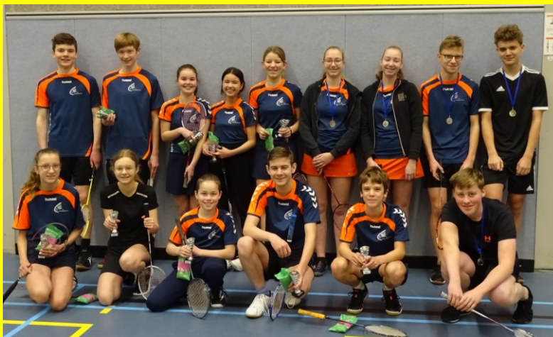
De spelers van de teams 1, 2 en 3